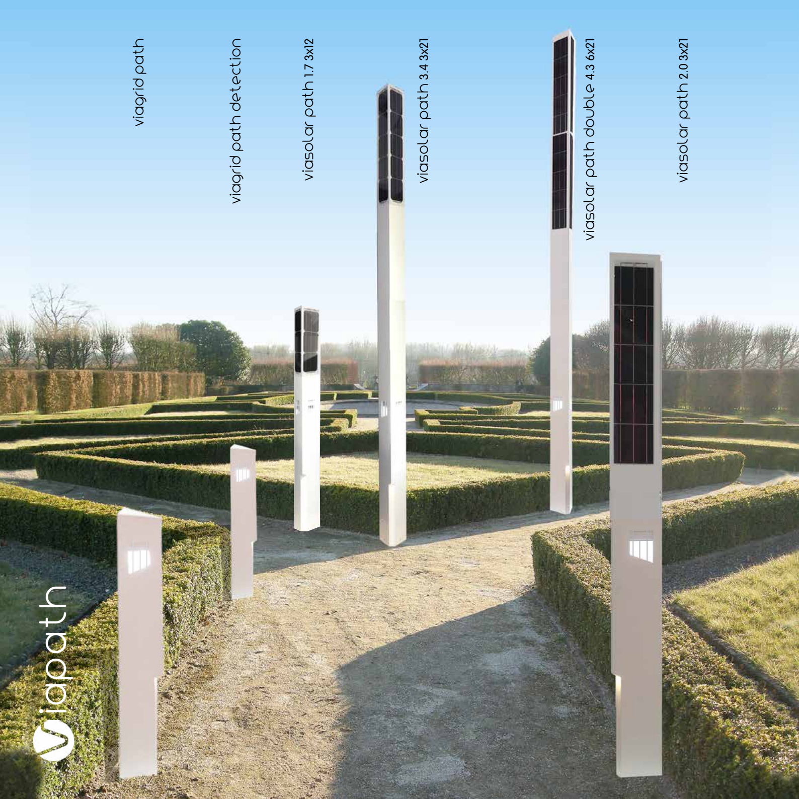
viasolar path 2.0 3x21